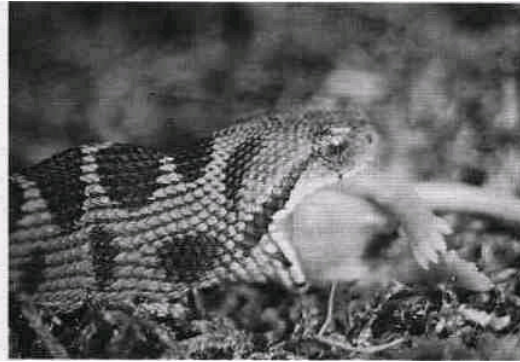
Abb. 5: Zwei Monate alte Bergotter der südlichen Form beim Verschlingen einer ca. 3 g schweren Maus

zwei Wochen gewechselt wird, einem Stück gebogener Korkrinde als Unterschlupf und einem Trinkgefäß.